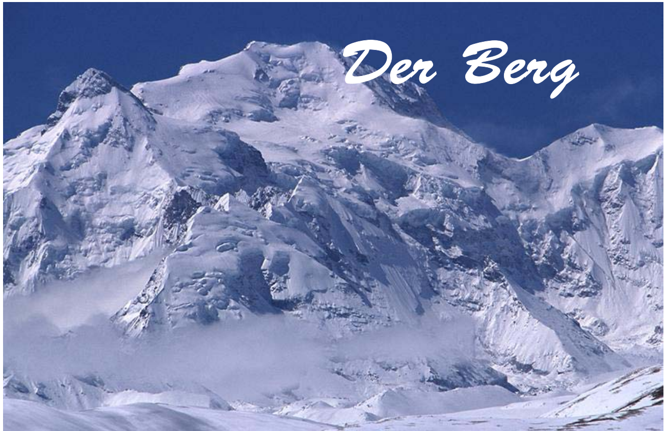
Shishapangma von Nordosten, Foto:© Romana Chapman

Mit 8027 m ist der Shishapangma der niedrigste der Achttausender und gleichzeitig der vierzehnthöchste Berg der Erde. Als einziger Achttausender liegt er zur Gänze auf tibetischem Gebiet.